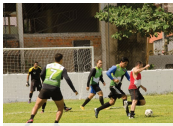
Torneio de futebol Intercampi