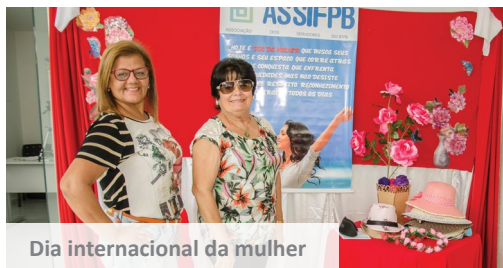
Dia internacional da mulher