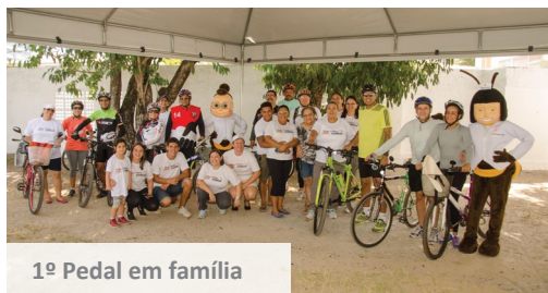
1º Pedal em família