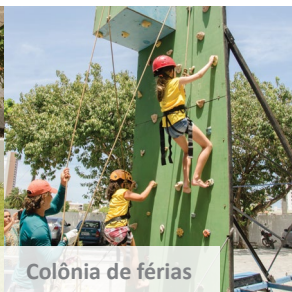
Colônia de férias