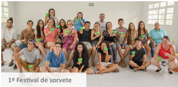
1º Festival de sorvete