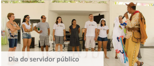
Dia do servidor público